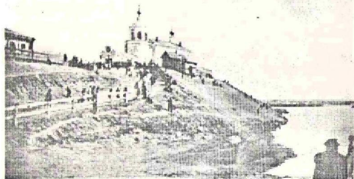
Георгиевский собор. Форштадт