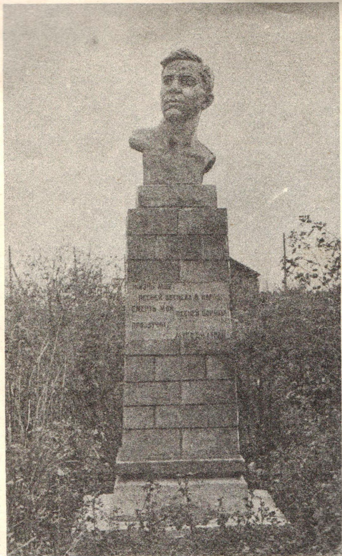
Памятник поэту-Герою Мусе Джалилю в селе Мустафино Шарлыкского района.

Муса Джалиль родился 15 февраля 1906 года в селе Мустафино нынешнего Шарлыкского района Оренбургской губернии. Здесь он, будучи подростком, объединил ребят из бедноты в отряд юных коммунаров «Красный цветок», ставших впоследствии первыми пионерами села. Слава о делах этого отряда облетела всю губернию.