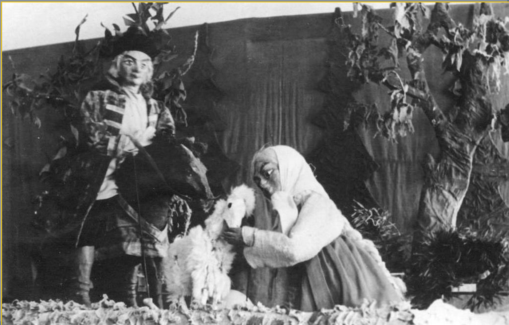
Сцена из спектакля « Сестрица Аленушка и братец Иванушка », Е. Черняк Режиссер - З.В. Ладонкина, художник и куклы - Н.М. Беззубцев 1954 г.