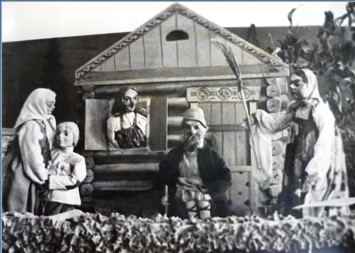
Сцена из спектакля «Сестрица Аленушка и братец Иванушка» , Е. Черняк Режиссер - З.В. Ладонкина, художник и куклы - Н.М. Беззубцев 1954 г.