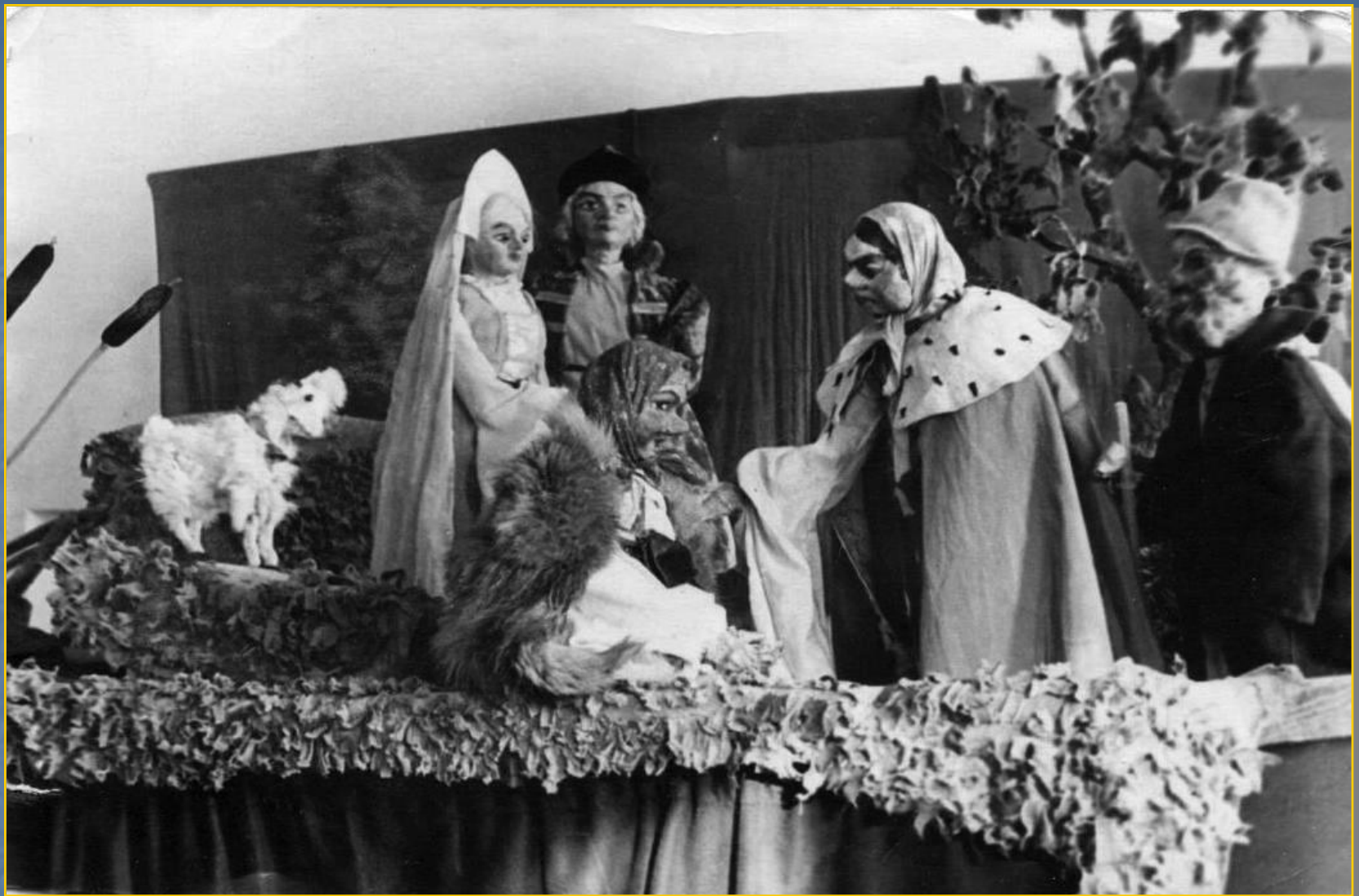
Сцена из спектакля « Сестрица Аленушка и братец Иванушка », Е. Черняк Режиссер - З.В. Ладонкина, художник и куклы - Н.М. Беззубцев 1954 г.