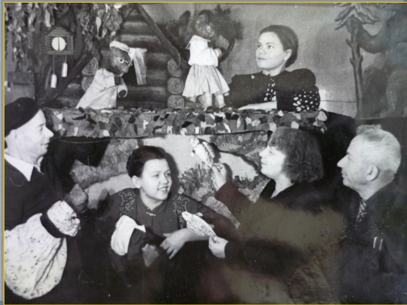
«Веселые медвежата» М. Поливанова, 1955 г. Режиссер - З.В. Ладонкина, художник - М.М. Молодяшин, куклы - Н.М. Беззубцев,