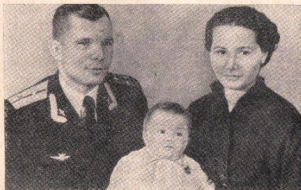
Рис. 3. Юрий Гагарин с женой Валентиной и дочерью Лепочкой.

Мои чувства и думы перед полетом и во время полета