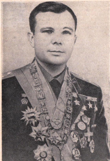
Рис. 1. Летчик-космонавт СССР, Герой Советского Союза полковник Гагарин Юрий Алексеевич.