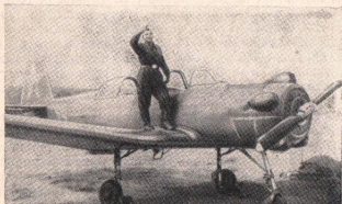
Рис. 2. Юрий Гагарин в годы учебы в Саратовском аэроклубе.

Константин Эдуардович Циолковский писал много лет назад: «Сначала неизбежно идут: мысль, фантазия, сказка. За ними шествует научный расчет. И уже в конце концов исполнение венчает мысль». Мы были свидетелями исполнения самой смелой творческой мысли. Юрий Гагарин должен был вылететь в космос лишь после того, как ученые получают полную уверенность в том, что он живым и здоровым вернется на Землю.