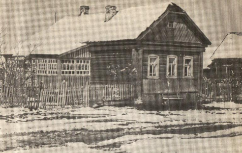
Юрий Гагарин. В Клушине наш дом стоял вторым на околице, у дороги на Гжатск.

Бывало, забудешься, прикрикнешь: «А ну за уроки!» — и пожалеешь: не в охотку ему занятия из-под палки.