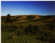
Степная лесостепь на иппуриях Малого и Большого Кинеля