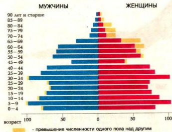
ПОЛОВОЗРАСТНАЯ ПИРАМИДА НАСЕЛЕНИЯ ОРЕНБУРГСКОЙ ОБЛАСТИ (на 12.01.1989 г., тысяч человек)

Механический прирост населения обусловлен прибытием в область на постоянное жительство русскоязычного населения из государств ближнего зарубежья.