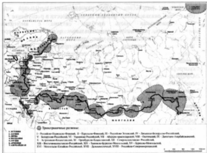
Рис. 3. Трансграничные регионы российского порубежья

На рис. 3 показаны трансграничные регионы, большинство из которых образовались после распада СССР. Какие проблемы возникли в связи с их появлением? Найдите на карте свой регион. Что вам известно о нем?