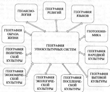
Рис. 1. Структура этнокультурной географии

Изучением этих компонентов занимаются отдельные науки, которые являются составными частями этнокультурной географии. Они показаны на рисунке 1.