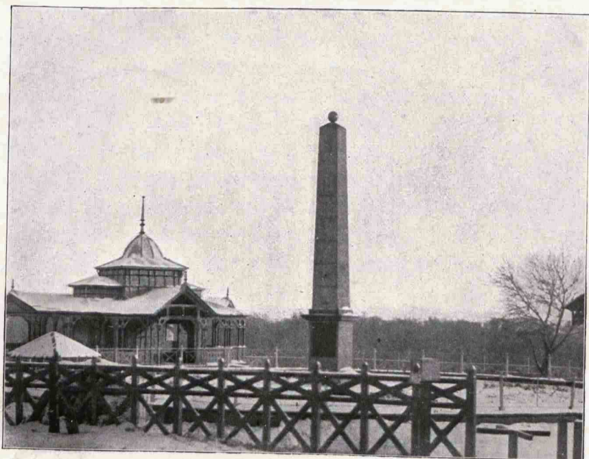
Памятникъ освобожденія города отъ воинскаго поста.