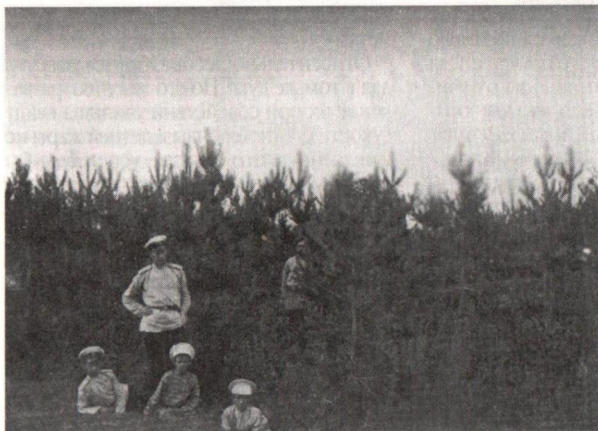
Сосновые посадки в Бутурусанском уезде. Конец XIX – начало XX в.