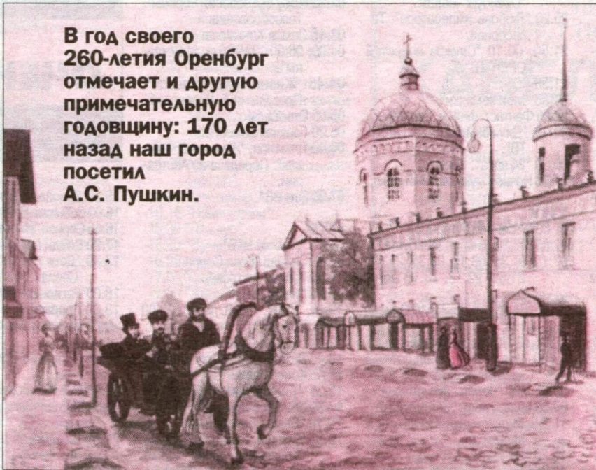
Александр Сергеевич Пушкин и Василий Алексеевич Перовский, конечно же, проезжали по главной улице города — Николаевской (Советской). Тогда она выглядела так: с левой стороны виден краешек дома с мезонином — это дом Тимашевых (Советская, 32), а справа — восточная сторона гостиного двора и Вознесенской церкви (она не сохранилась)

В год своего 260-летия Оренбург отмечает и другую примечательную годовщину: 170 лет назад наш город посетил А.С. Пушкин.