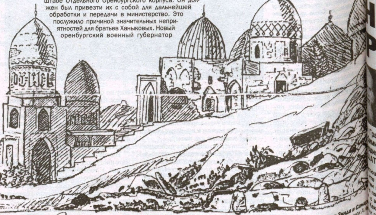
Мавзолей Шах-и Зинда в Самарканде. Рисунок А.И. Герцена.

Это путешествие имело для него – как востоковед – огромное значение. Он хорошо узнал Гератскую долину, ее природу и население, собрал богатый этнографический и антропологический материал, дал описание архитектурных и исторических памятников Герата, составил его археологическую карту. Обработкой полу-