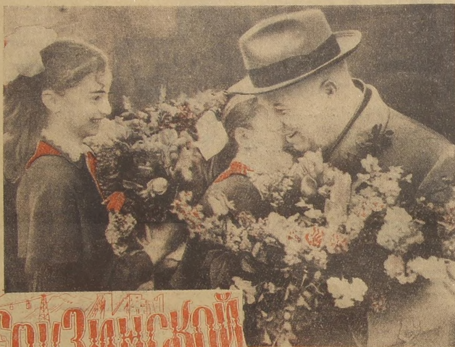
Так сердечно встречали пионеры Н. С. Хрущёва, когда в начале этого года он приезжал в Тбилиси на совещание по сельскому хозяйству. А вчера, 11 мая, Никита Сергеевич снова приехал в Грузию — на праздник...