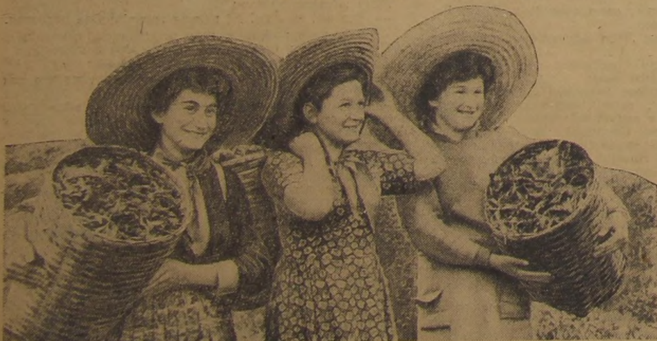
Пионерки — сборщицы чая.