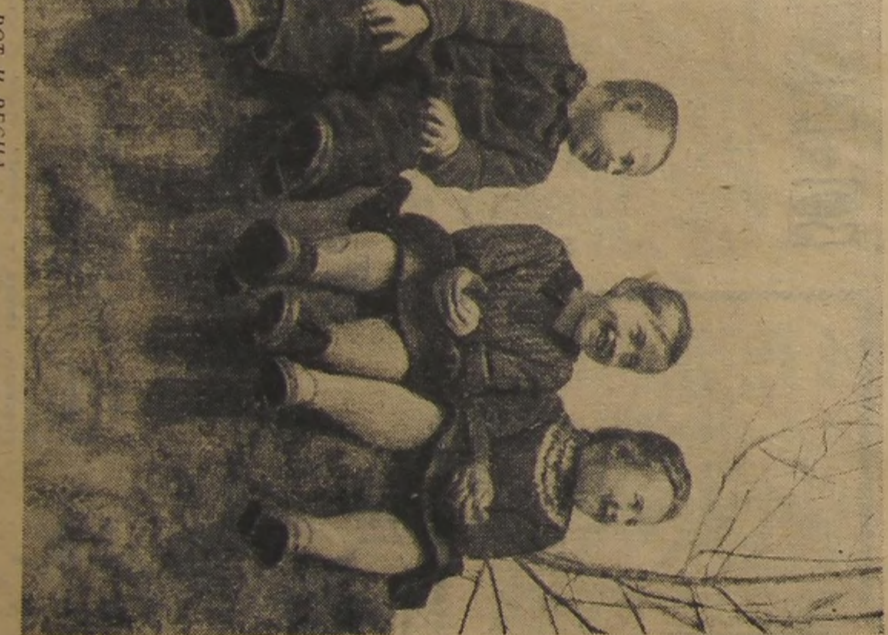
ВОТ И ВЕСНА...