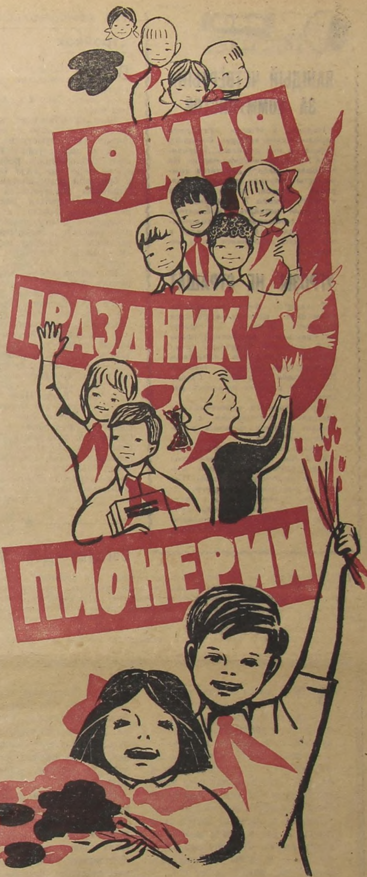
Рис. Е. ЛИТВИНОВА.