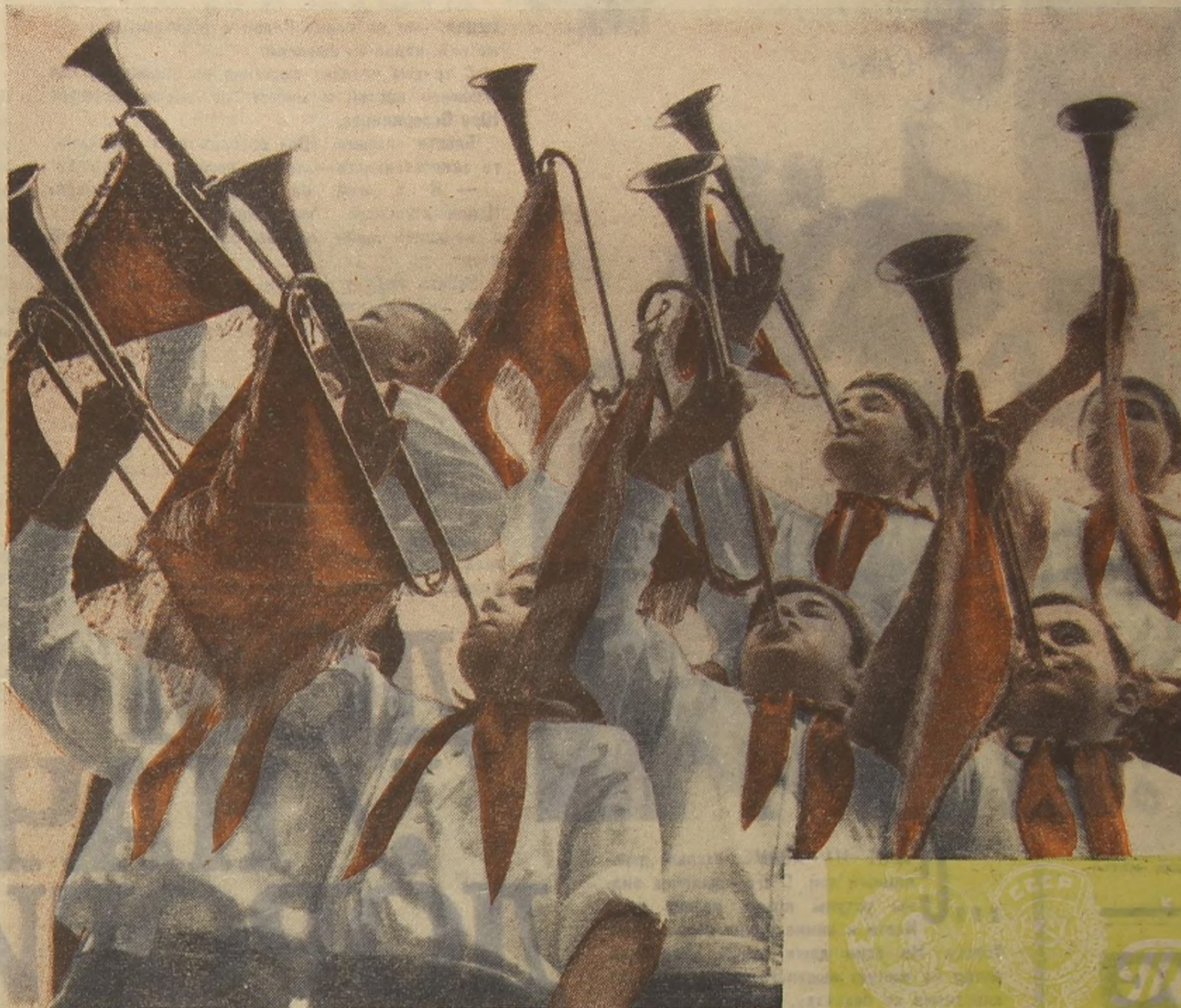
Горнисты 4-го класса «А» 480-й московской школы.