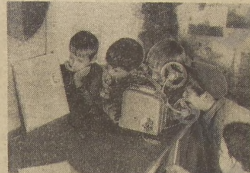
Фильмы снимали сами. Первые зрители, конечно, мы.

Ещё не раз приезжали сюда со своими фильмами и принимали друзей у себя. Летом даже