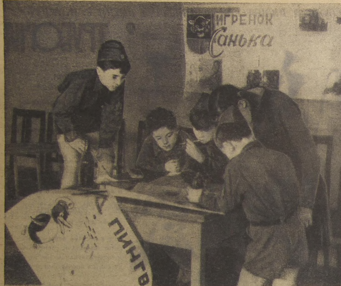
▲ Тесно в газете. Куда поставить ещё один материал? Вот и гадают...