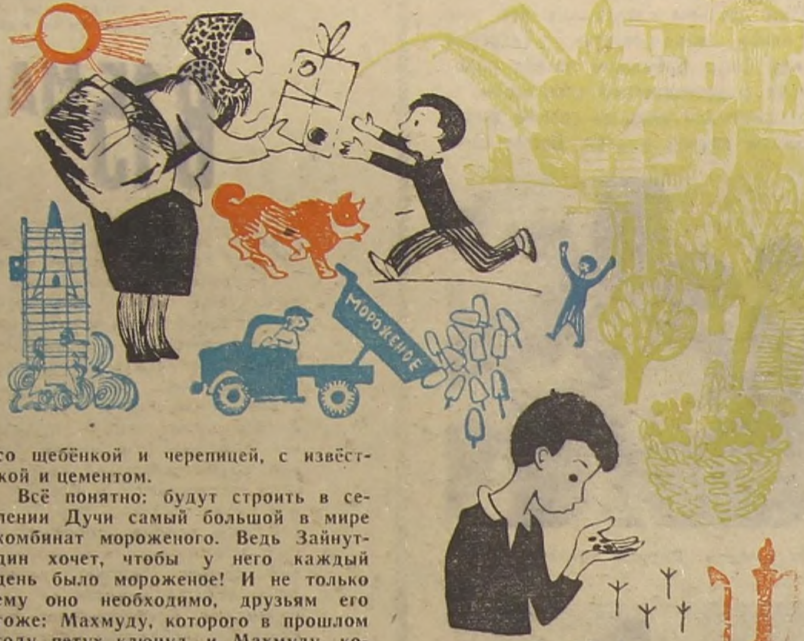
Рис. В. ЕВЛАДЕНКО.

со шибёнкой и черепицей, с известкой и цементом.