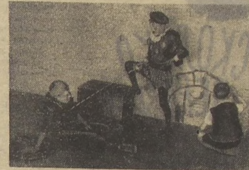
Хочешь в двадцатом веке увидеть мушкетёров? Приходи в наш театр.

в поход ходили вместе. Что это за радость видеть, как тебя ждут, зная, что ты нужен людям!