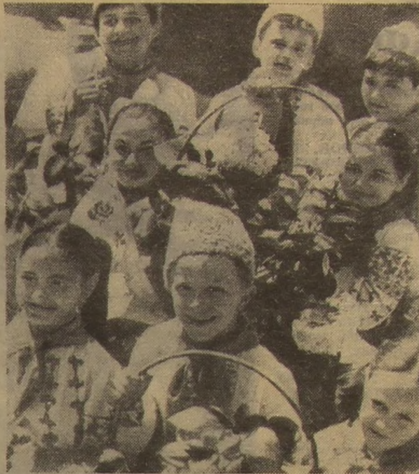
КИШИНЕВ. 19 мая. Празднику пионерии — юннатские букеты!

Капитан НИКИТИН, первый помощник капитана ЗЛОБИН, секретарь комсомольской организации СУРГАЙ.