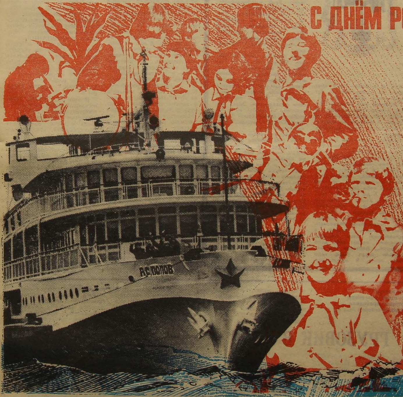
НА СНИМКЕ: теплоход «А. С. Попов», на котором 19 июня выйдут в рейс активные участники Всесоюзного пионерского Марша.

Поторопи время — откни листок календаря, загляни в завтра. Видишь — 19 мая 1979 года! Праздник! День рождения! Пятьдесят седьмая годовщина Всесоюзной пионерской организации имени Владимира Ильича Ленина. Это и твой день рождения, если тебе десять, двенадцать, четырнадцать. А ещё это день рождения и двадцатилетних, и сорокалетних — всех, кого воспитала, вырастила наша пионерская организация.