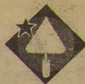
Рис. С. ШЕХОВА.

Чувашская АССР, село Альгешево, 8-летняя школа.