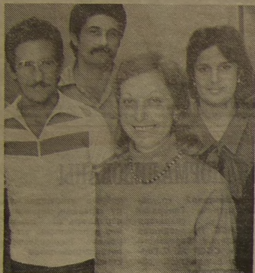
Мы, члены детской редакции «Пионерской правды» недавно встретились с делегацией ответственных работников кубинской пионерской организации имени Хосе Марти. Кубинские друзья попросили передать привет всем советским ребятам и поздравить с Днём рождения пионерской организации.

Во время встречи мы ответили на вопросы наших друзей. ВОПРОС. У вас в стране сейчас идёт перестройка. Часто мы слышим слово «еёланос». Как это коснулось вашей газеты? ОТВЕТ. Наша газета теперь выходит три раза в неделю. Раньше выходило только два раза. На страницах пионерской газеты стало больше детских голосов, интересных новых рубрик, острей строчек. Именно о том, что больше всего волнует ребят. Особенно сейчас заботит нас перестройка в пионерской организации. Мы хотим стать по-настоящему самостоятельными. А ещё боремся против несправедливости в школе, добиваемся достойного отношения к себе. ВОПРОС. Мы раньше видели вашу газету. Она была более красивой. Почему сейчас у неё меньше цветов? ОТВЕТ. Строится новый цех, наша типография перейдёт на более современное оборудование, и газета опять станет разноцветной. Мы все ждём этого с нетерпением. ВОПРОС. При своей пионерской газете мы тоже хотим организовать детскую редакцию. И даже уже пытались. Но у ребят мало времени. У всех дела в школе. А у вас есть какая-то специальная подготовка, чтобы выступать в газете? ОТВЕТ. Нет, специальной подготовки нет. Мы пишем о том, что нас волнует, выполняем задания редакции. И даже получаем гонорар. Если, конечно, наши заметки опубликуют. Но времени и у нас мало, хотя при желании можно успевать. Прощаясь, мы попросили передать горячий привет нашим кубинским ровесникам.