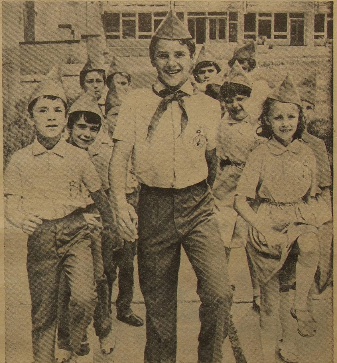
Раскройте нашу газету. Правда, симпатичные лица? Мальчишки и девчонки, которых вы увидите на второй и третьей страницах. — герои наших публикаций в разные годы. Может быть, узнаете себя на фотографиях и напишите нам? Вот было бы здорово! Ведь мы когда-то с вами встречались...

кто заботился о её чести и достоинстве не меньше, чем о своём, о пионерах, которые отдали свою жизнь за Отечество, то есть и за нас с вами. Ведь история нашей страны полна тяжёлых испытаний, и пионеры были всегда вместе со страной. Это день гордости за то, чем мы сегодня дорожим, что взяли, как из родника,