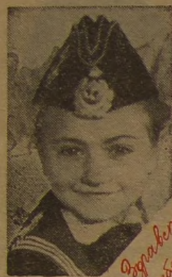
Одесская область, с. Нагорное.