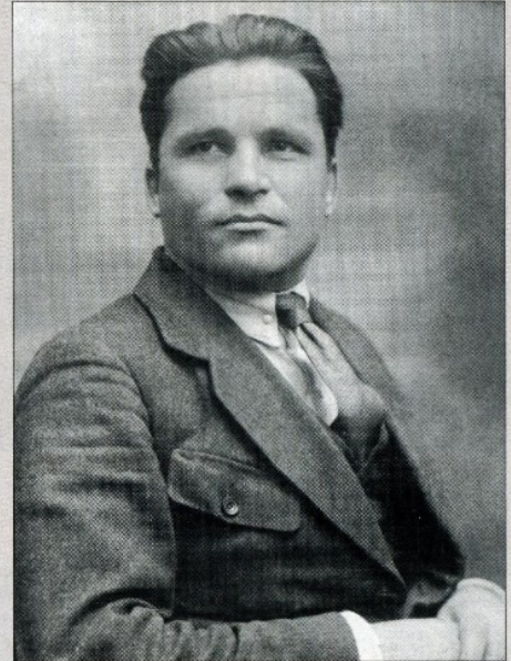
С. М. Киров. 1919 г.