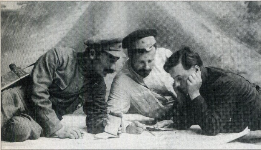
Командующий 1-й Конной армией С. М. Будённый, командующий южным фронтом М. В. Фрунзе и член РВС 1-й Конной армии К. Е. Ворошилов за картой. 1920 г.