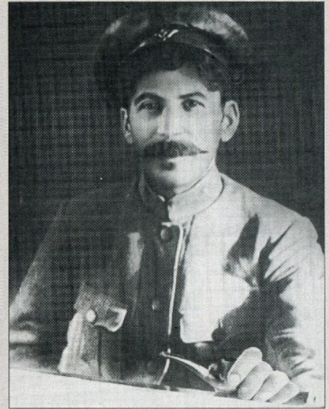
И. В. Сталин. 1918 г.