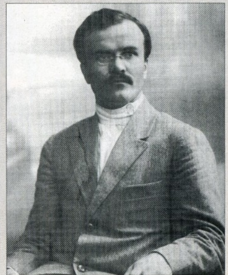
В. М. Молотов. 1930 г.