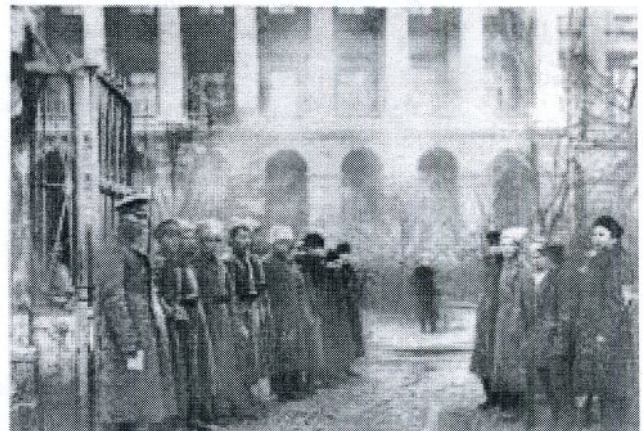
Патруль революционных солдат и красногвардейцев у Смольного в октябре 1917 г.