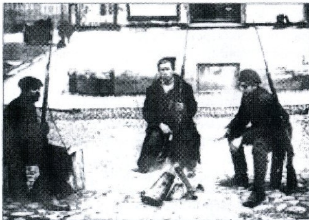
Красногвардейский патруль у Смольного. Октябрь 1917 г.