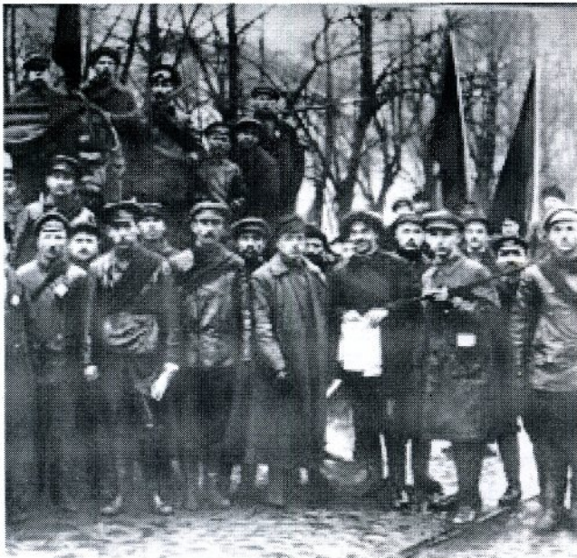
Накауне революции: революционные красногвардейцы в октябре 1917 г.

18 октября в газете «Новая жизнь» опубликована статья «Ю. Каменев о «выступлении»». В ней Л. Б. Каменев от своего имени и от имени Г. Е. Зиновьева выразил несогласие с резолюцией ЦК РСДРП(б) о вооруженном восстании, выдав таким образом план восстания. 24-25 октября произошло вооружённое восстание рабочих, солдат и матросов в Петрограде. В ночь на 25 октября Ленин прибыл в Смольный.